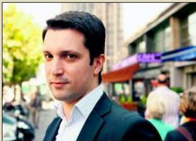
LE PARISIEN ÉCONOMIE

LE PARISIEN ÉCONOMIE | LUNDI 29 JUIN 2009